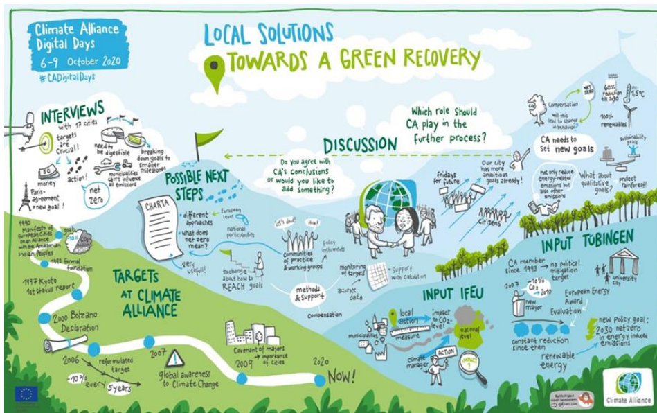
Graphic Recording der Zieldiskussion im Rahmen der Klima-Bündnis Digital Days im Oktober 2020

Dieser Entwurf für eine Klima-Bündnis-Charta erneuert im Lichte dieser Entwicklungen die bestehende Selbstverpflichtung für eine „kontinuierliche Reduktion der Treibhausgasemissionen“ (Satzung des Klima-Bündnis) und erweitert die Zielsetzung zu einem Zielkorridor, der die Mitglieder des Klima-Bündnis bei ihren lokalen Klimaschutzstrategien unterstützen soll.