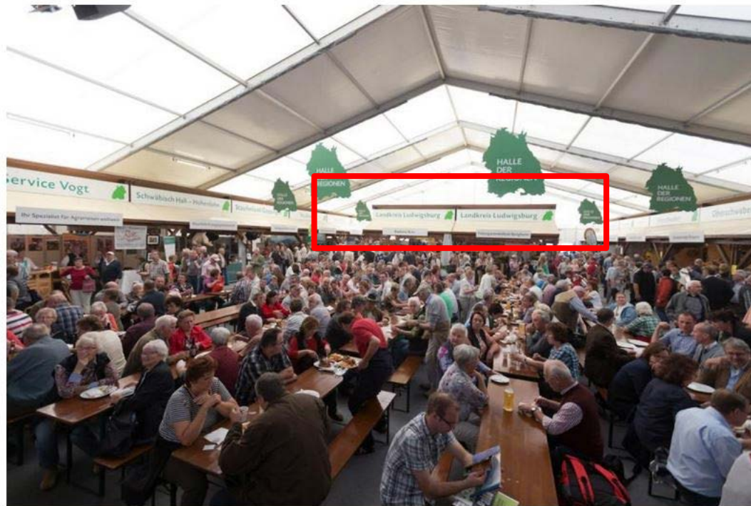
Halle der Regionen - ein Anziehungspunkt (Halle 4)