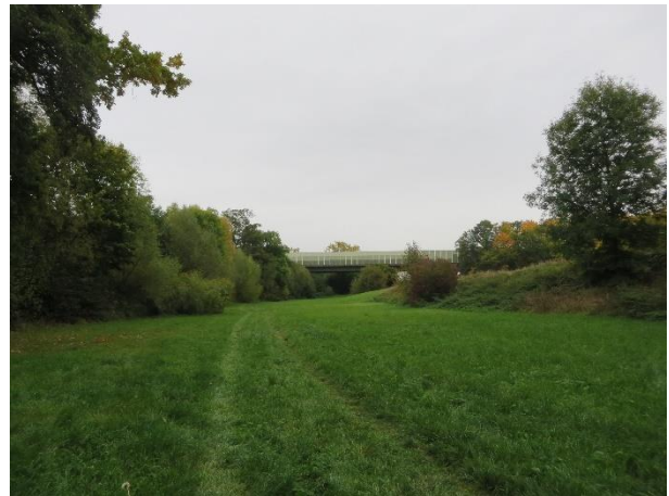
Foto 2: Blick durchs untere Scheffzental Richtung Autobahnbrücke der BAB A81