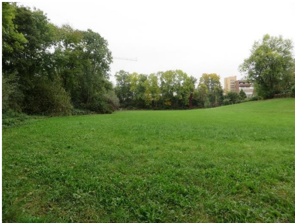
Foto 1: Blick zum Straßendamm an der Siemensstraße (Unteres Scheffzental); Talau mit Gehölzen am Straßendamm und gewässerbegleitende Gehölze