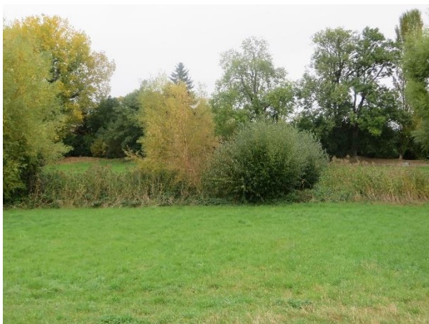
Foto 5: Blick auf den mittig durch das obere Scheffzental verlaufenden Graben mit Schilfbestand und Gehölzen