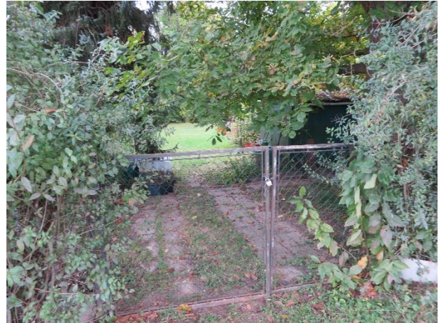
Foto 8: Einzelner Kleingarten innerhalb des oberen Scheffzentaales