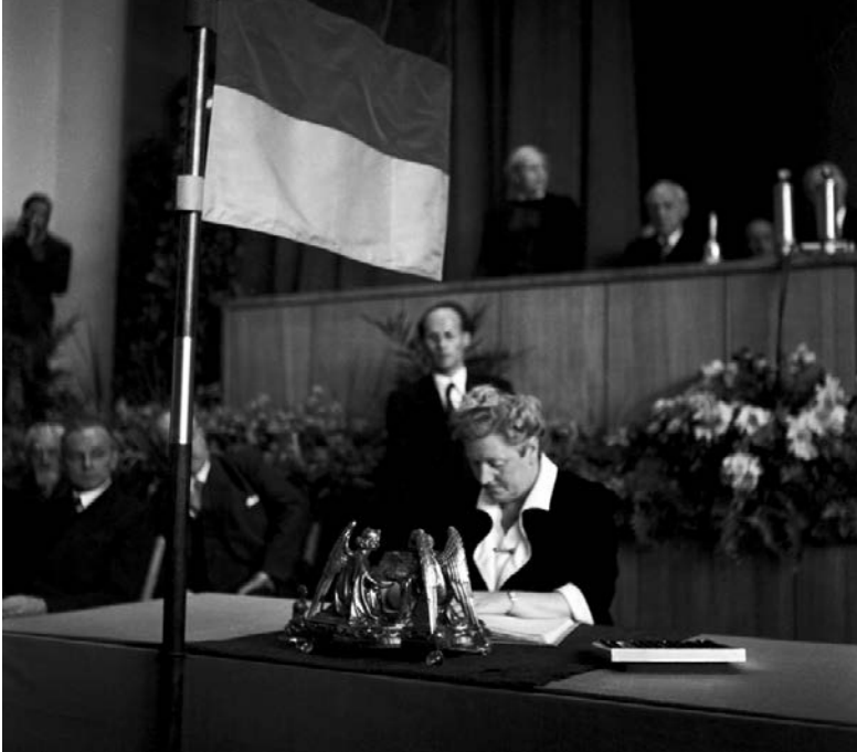
23. Mai 1949 – Elisabeth Selbert unterzeichnet das Grundgesetz