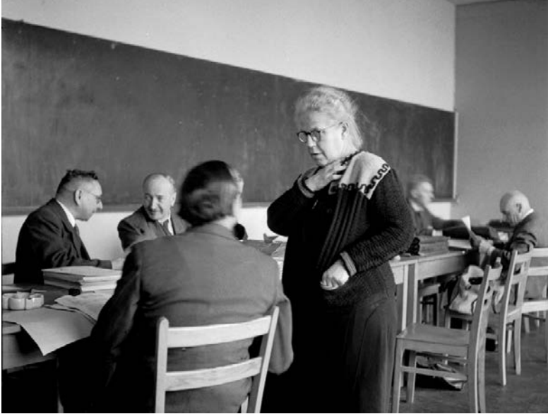
Helene Weber im Gespräch mit Fraktionskollegen des Parlamentarischen Rates