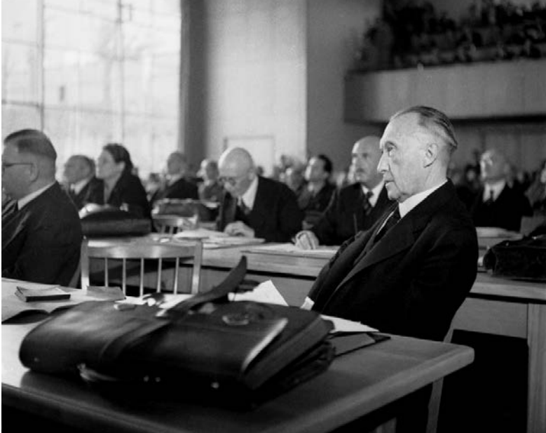
Der spätere Bundeskanzler Konrad Adenauer (CDU) leitete als Präsident die Beratungen des Parlamentarischen Rates