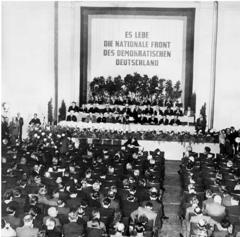
Sitzung des Nationalrates zur Gründung der Deutschen Demokratischen Republik am 7. Oktober 1949

Am 19. März 1949 nahm der Volksrat die ausgearbeitete Vorlage als „Verfassung der Deutschen Demokratischen Republik“ an. Die sowjetische Besatzungsmacht zögerte allerdings die Konstituierung der DDR noch bis zum 7. Oktober 1949 hinaus, um die Wahlen zum Bundestag im August 1949 und die Konstituierung der Bundesregierung im September 1949 abzuwarten. Die Verfassung der DDR formulierte ihren Geltungsanspruch als „gesamtdeutsch“, daher gibt es im Text keinerlei Hinweise auf die Gültigkeit als Provisorium bis zur Wiederherstellung der staatlichen Einheit Deutschlands.