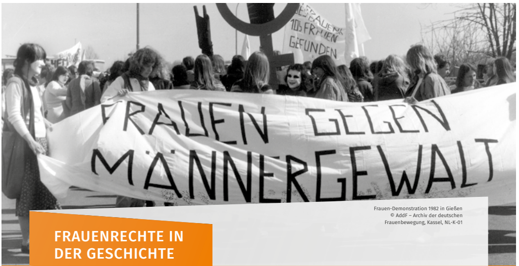
Frauen-Demonstration 1982 in Giessen