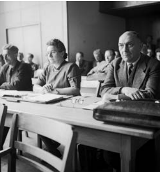
Bei der konstituierenden Sitzung des Parlamentarischen Rates

Frieda Nadig, Bundestagsrede am 27.11.1952