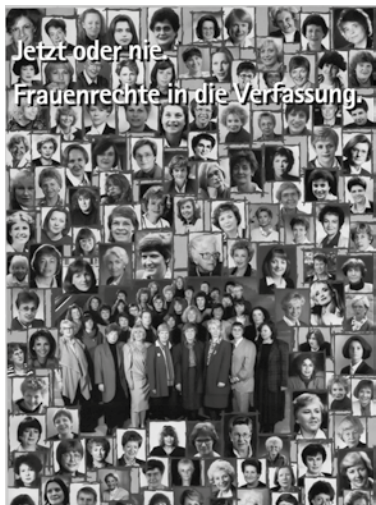
Plakat der Kampagne „Jetzt oder nie. Frauenrechte in die Verfassung“