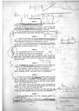
Das Exemplar des Grundgesetzes von Elisabeth Selbert

Am 18. Januar 1949 wurde der Gleichheitsgrundsatz in der Sitzung des Hauptausschusses einstimmig angenommen und im Grundgesetz verankert.